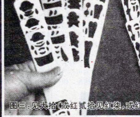
图三：见夫拾（或红贰拾见红柒，或红柒拾见红贰），六十三和正。