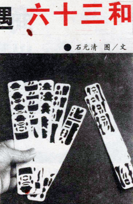
图二：红捌开起喊二十块。

据考证，贰柒拾最大的和数为六十三和。和六十三和，首先要有两个先决条件，一是当头家，即可起21张牌；二是起牌后不出字。但事实上据笔者所闻，至今谁也没拿到过这样一手牌，有人说这恐怕千年也难遇一次，但愿你有这好运气。图为六十三和和法的三个步骤。