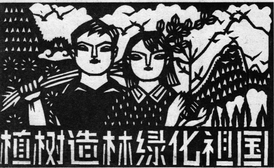
▲植树造林 绿化祖国(剪纸) 黄佩达