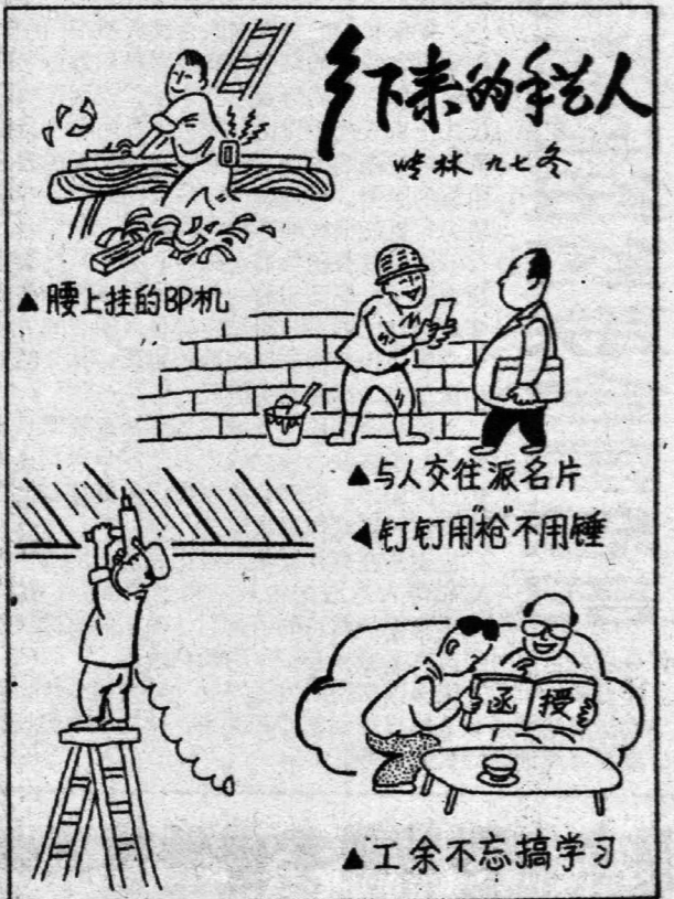
乡下来的手艺人(漫画)